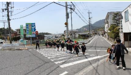
横断歩道も気を付けて