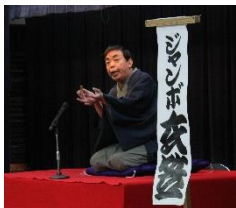
大野西小の幼馴染

4月13日、春の集い「落語会と茶話会」を女性会と福祉部会との共催でおこない、「ジャンボ衣笠」さんの落語に70名近くの参加がありました。落語は「詐欺」をテーマにしたものでしたから、振り込め詐欺（オレオレ詐欺、架空請求詐欺）を始めとする「特殊詐欺」の実例が紹介され、年間390億円をだまし取られているそうで、廿日市市でもH28年度は6,135万円の被害があったそうです。この話を枕に「時そば」という古典落語が演じられました。今回も大野西小学校の幼馴染です・・・と3人の仲良しさんが参加され、毎日午前6時頃には集まって40分間お散歩をするそうで、「2020年、2年後の東京オリンピックの年の春には、新宮島口桟橋が出来ますよ！」と御紹介すると、「そりゃ、歩いて行かやいけん。」と即座におっしゃいました。友達っていいですね。