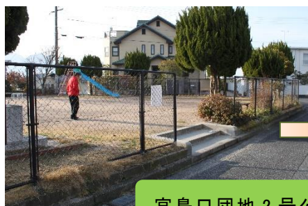
宮島口団地2号公園（5台）