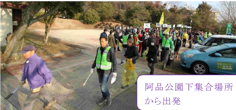
阿品公園下集合場所から出発

阿品・阿品台・宮島口東を16に班分けし、児童・生徒を主体に500名を超える参加者で通学路の清掃活動を実施しました。