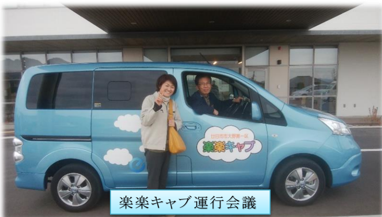
楽楽キャブ運行会議

皆様が楽しみにしていたプロ野球もいつ開幕できるのか、さらには学校や職場はどうなるのか、不安な日々が続きます。外出自粛が続きますが体調に気を付けて元気で過ごしましょう。