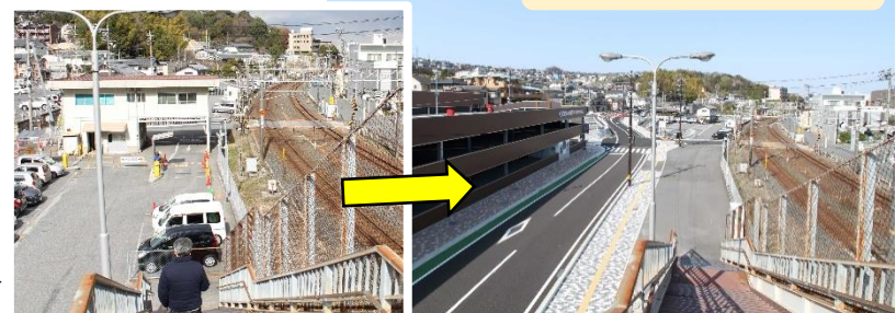
小浦眼科方面を見る