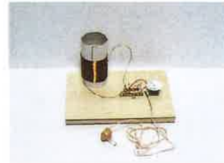
鉱石ラジオの一例

コンセントにつないでいないのに、電池もつかっていないのに聞こえる不思議なラジオ！ 鉱石(こうせき)ラジオを作ります。災害停電のときに役に立つラジオです！！